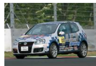
VW GTI Cup Japan (Japan)