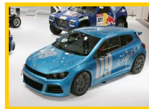
VW Scirocco Cup (China) シロッコカップカーによるワンメイクレース。