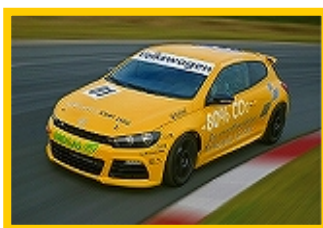
ADAC VW Scirocco Cup (Germany: 2010-)