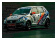
ENGEN Polo Cup (South Africa)

ヨーロッパ最高峰のGTレース、DTM(ドイツツーリングカー選手権)のサポートレースとして開催。7万人を超える観客の中、ハイクオリティのレースを経験出来る。車両は2010年からCNG(圧縮天然ガス)を使用したシロッコカップカー使用。