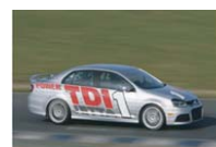
VW Jetta TDI Cup (U.S.A)