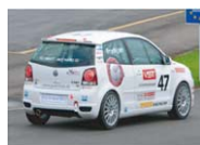
VW Polo Cup (India 2010-)