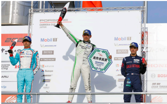
Pro Class Podium