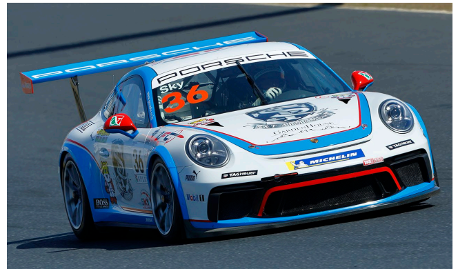
#36 Sky Chen