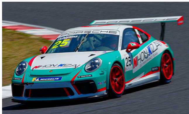
#25 Kiyoshi UCHIYAMA

第1戦の決勝レースは10日(土)16時スタート、第2戦は11日(日)9時45分スタートを予定しており、両日とも15周もしくは30分間で競われる。なお、第1-2戦の決勝レースはポルシェジャパンのtwitterアカウント (@PorscheJP) で各日ともライブストリーミング配信されます。