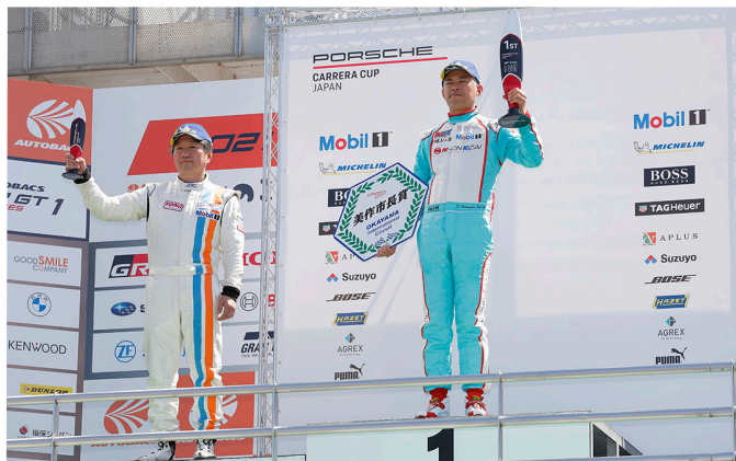
Am Class Podium