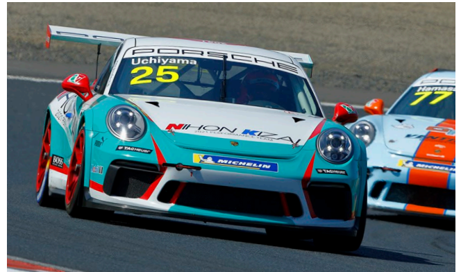
#25 Kiyoshi UCHIYAMA

PCCJ 第 3-4 戦は 5 月 3 日 (月・祝日)、4 日 (火・祝日) に富士スピードウェイ (静岡県) で開催が予定されている。富士スピードウェイは、開幕前の合同テストが開催されるなど各ドライバーが走り込んでいるサーキットだけに、誰にも優勝のチャンスがあると言える。