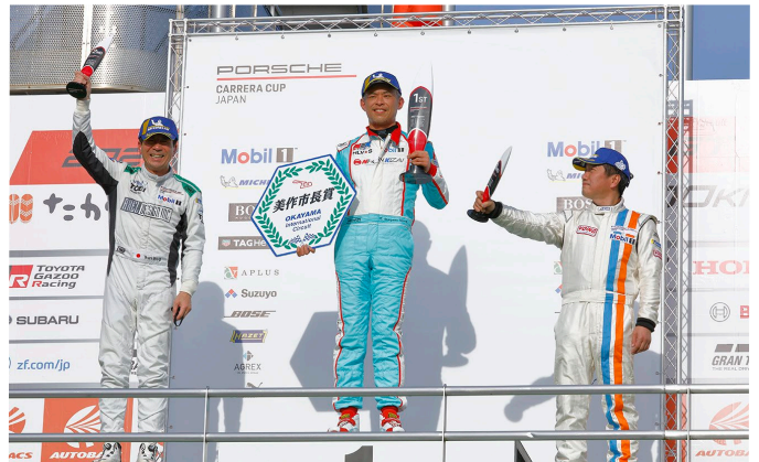
ProAm Class Podium