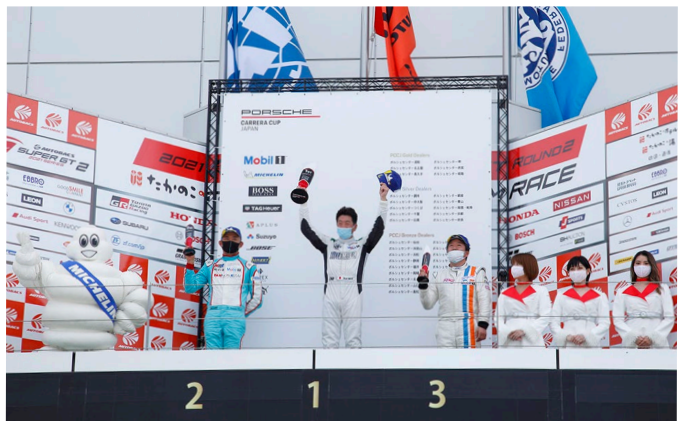
Pro Am Class Podium