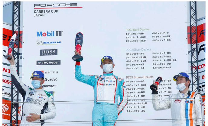
ProAm Class Podium