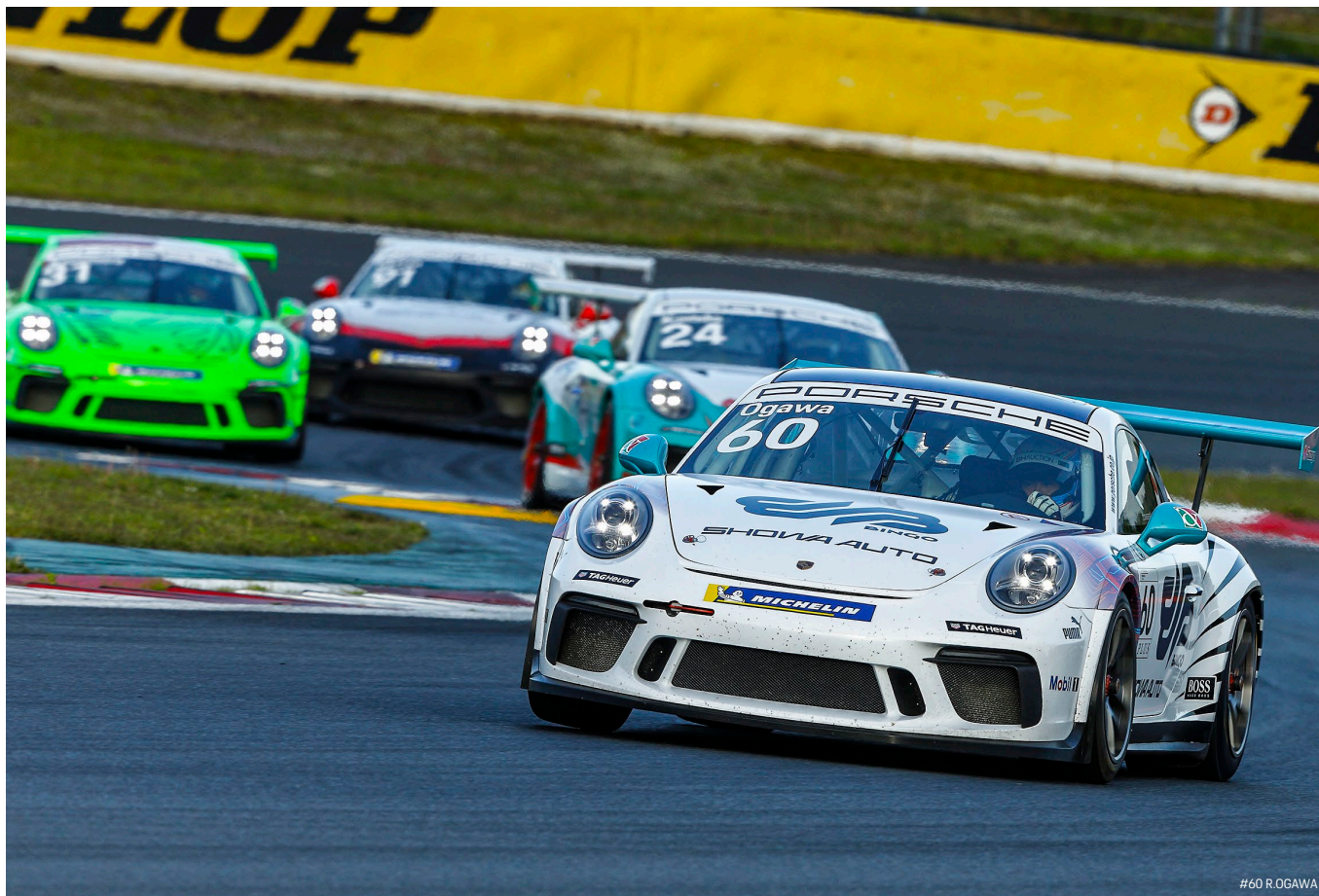
#60 R. OGAWA