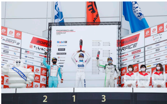
Pro Class Podium