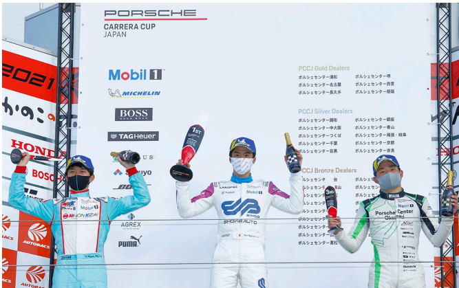
Pro Class Podium