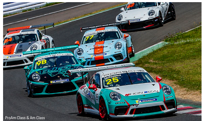
ProAm Class & Am Class