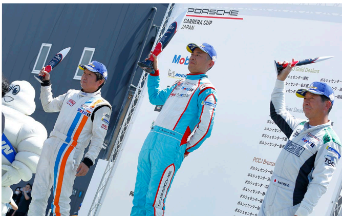
Pro Am Class Podium