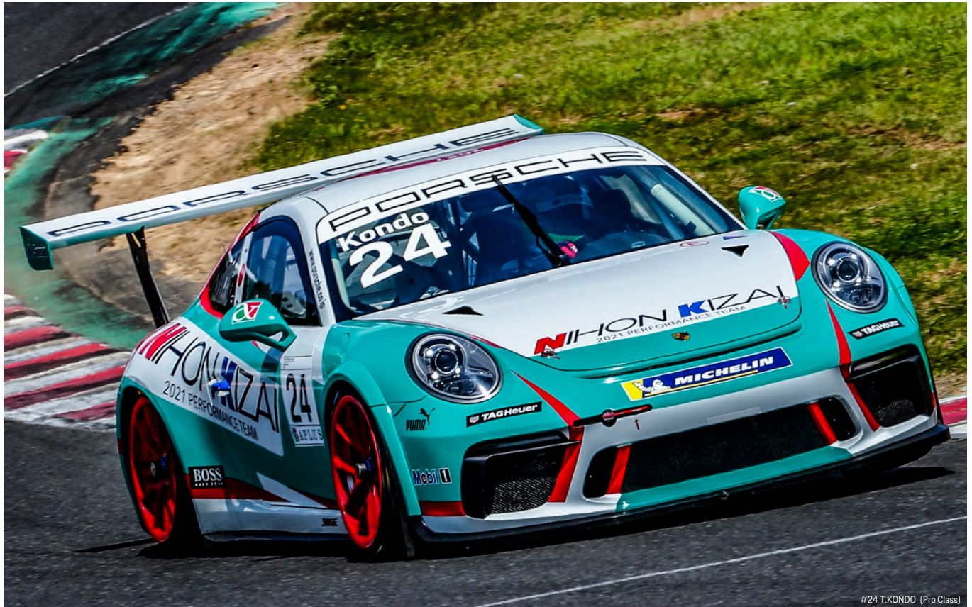
#24 T.KONDO (Pro Class)