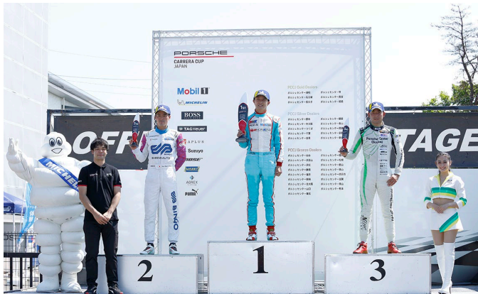
Pro Class Podium