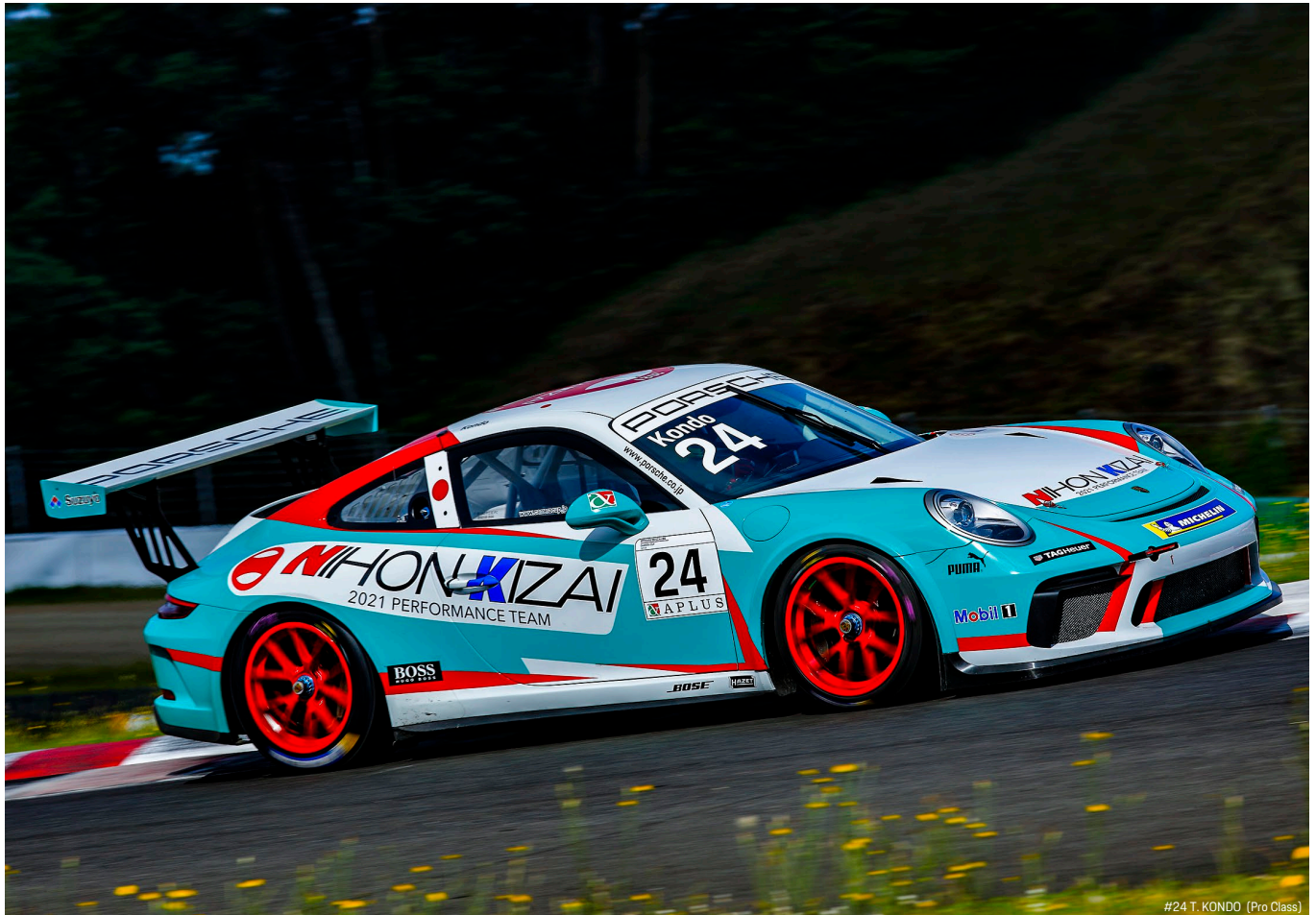
#24 T. KONDO (Pro Class)

Porsche Carrera Cup Japan 2021 - Round 7-8 Qualify