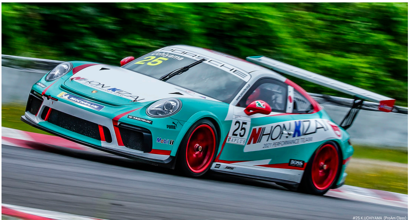
#25 K.UCHIYAMA (ProAm Class)