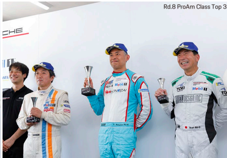
Rd.8 ProAm Class Top 3