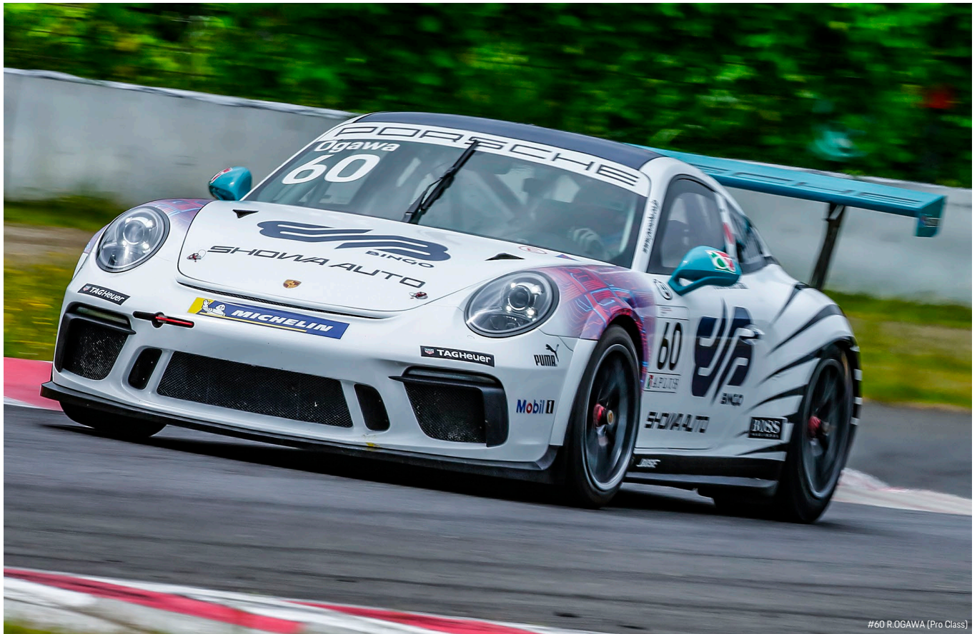
#60 R. OGAWA (Pro Class)

今シーズンの PCCJ は、4 月 10～11 日に岡山国際サーキットで開催された第 1-2 戦で幕を開け、5 月 2～3 日に富士スピードウェイで第 3-4 戦を開催。そして第 5-6 戦は 5 月 29～30 日に鈴鹿サーキットでの開催を予定していたが、新型コロナウイルス感染症の拡大に伴い 8 月 21～22 日に開催を延期した。今シーズンは全 11 戦の開催を予定しており、今回の SUGO 大会がシーズン中盤戦となるため、「プロクラス (Pro)」、「プロアマクラス (ProAm)」、「アマクラス (Am)」の 3 クラスともシーズン後半戦の行方を左右する重要なレースとなってくる。