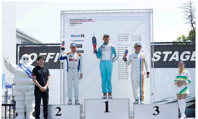
ProAm Class Podium