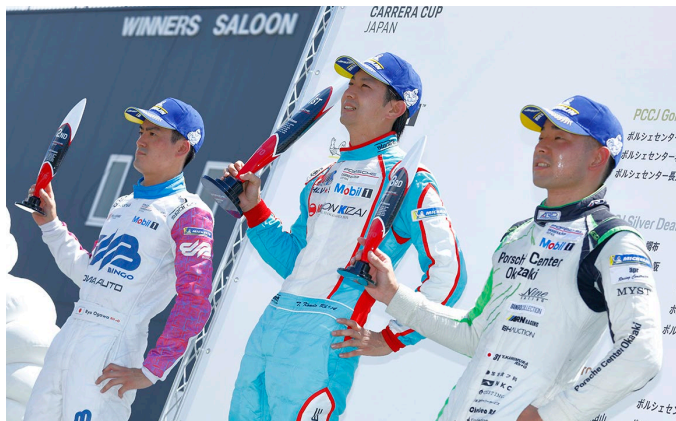
Pro Class Podium