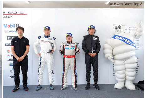
Rd.8 Am Class Top 3