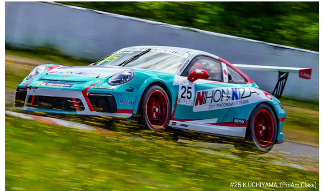
#25 K.UCHIYAMA (ProAm Class)

な次回の PCCJ は新型コロナウイルス感染症の影響で開催が延期された第 5-6 戦が、8 月 21 日 (土)、22 日 (日) に鈴鹿サーキット (三重県) で開催される。鈴鹿サーキットでの PCCJ 開催は 2019 年 5 月 26 日以来となるため、実力伯仲の接戦レースが続いている各クラスで、どのようなレースが展開されるのか注目される。