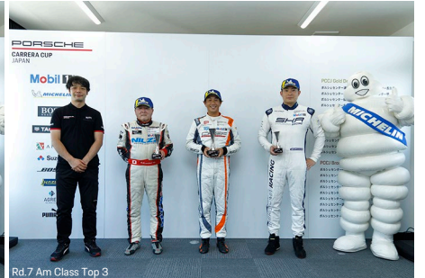
Rd.7 Am Class Top 3