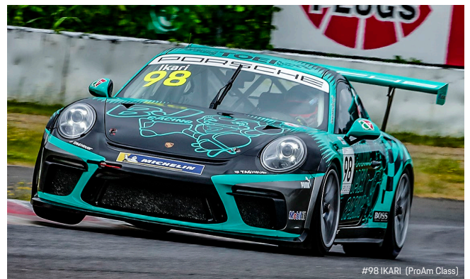
#98 IKARI (ProAm Class)