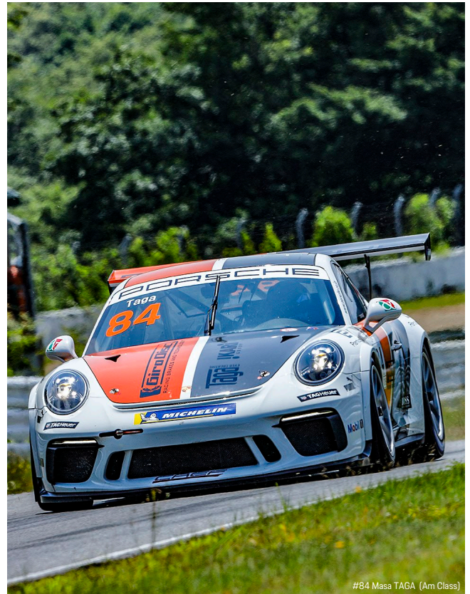
#84 Masa TAGA (Am Class)

PCCJ 第7-8戦 SUGO大会のスケジュールは、専有走行が7月23日(金) 10時10分~10時40分、12時50分~13時20分と各30分間の2セッション。予選は7月24日(土) 8時30分~9時00分の30分間の1回のみ。そして決勝レースは、第7戦が24日(土) 13時05分スタート(15周もしくは30分間)、第8戦が25日(日) 11時40分スタート(15周もしくは30分間)となっている。