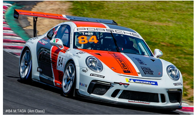
#84 M.TAGA (Am Class)