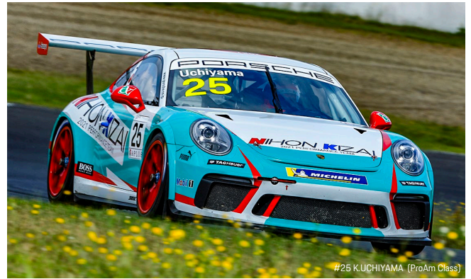
#25 K. UCHIYAMA (ProAm Class)

第7戦の決勝レースは24日(土) 13時05分、第8戦は25日(日)の11時40分のスタートを予定しており、両日ともに15周もしくは30分間で競われる。