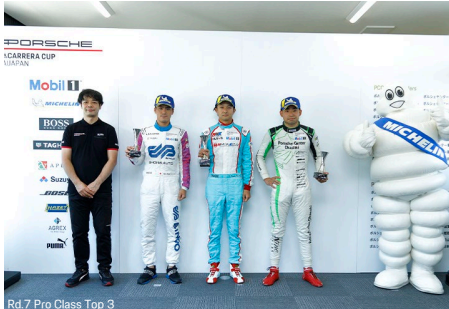
Rd.7 Pro Class Top 3