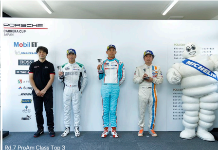
Rd.7 ProAm Class Top 3