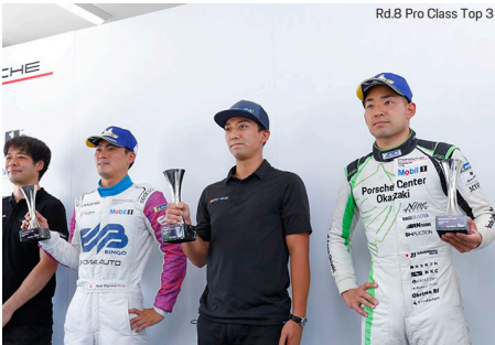
Rd.8 Pro Class Top 3