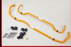
COX Stabilizer Set