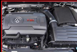
■ COX ECU for Golf VII C20T

さらにスポーツ性能を追求した車高調整式サスペンションキット装着モデルもございます。詳しくはスタッフまでお問い合わせください