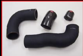
COX Turbo Pipe Kit