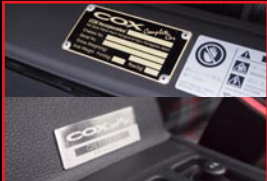
■ Engine Room Plate ■ Interior Plate