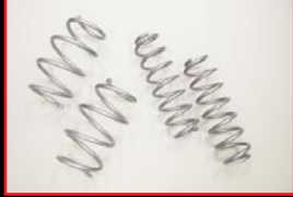
COX Original Spring Kit