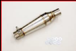
COX Exhaust Chamber