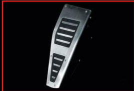
Foot Rest (Volkswagen Accessories)

※ ■の製品は、C20Tコンプリートパッケージ専用用品(非売品)です。 ※ 上記製品の仕様やデザイン等につきましては予告なく変更となる場合があります。 ※ マフラーのテールカラーはポリッシュテールからブラックテールに変更可能です。