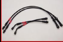
COX Brake Line System Set