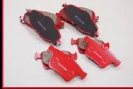
COX Brake Pad Set