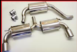
COX Stainless 2pcs Muffler