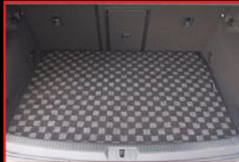
COX Original Trunk Mat