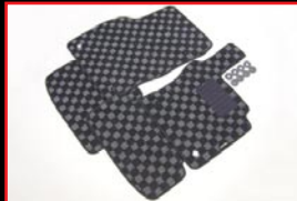
COX Original Floor Mat