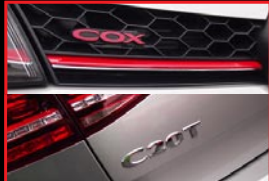
■ Front COX Emblem (Red) ■ Rear C20T Emblem