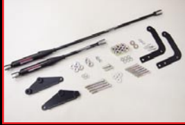
COX Body Damper