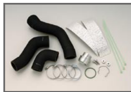
COX H/D Turbo Pipe