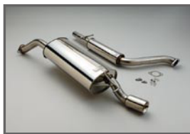
COX 2pcs Stainless Muffler