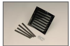
Inter Cooler Cooling Air Outlet