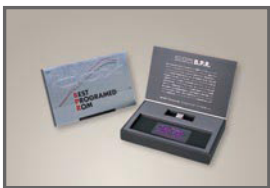
■COX B.P.R (SZ Special Program)