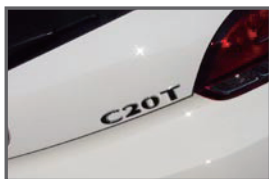
■ Rear C20T Emblem