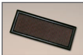
K&N Replacement Filter