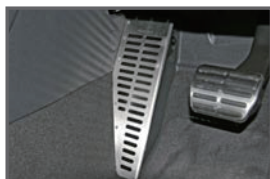
Foot Rest Cover