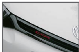
■ Front COX Red Emblem