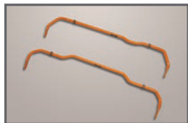
■ Stabilizer Fr(24φ)/Rr(22φ)