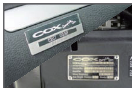
■ Interior Plate ■ Engine Room Plate