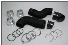
■ COX H/D Turbo Pipe (4pcs)