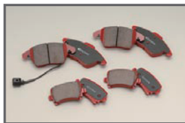
COX Brake Pads Kit