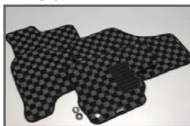
COX Floor Mat