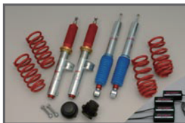
SACHS Racing Suspension Kit (Setting by COX / DCC Cancellerft)