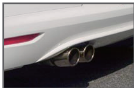
COX 2pcs Muffler