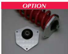
Spherical Bearing upper mount ¥149,000 (工賃含む)