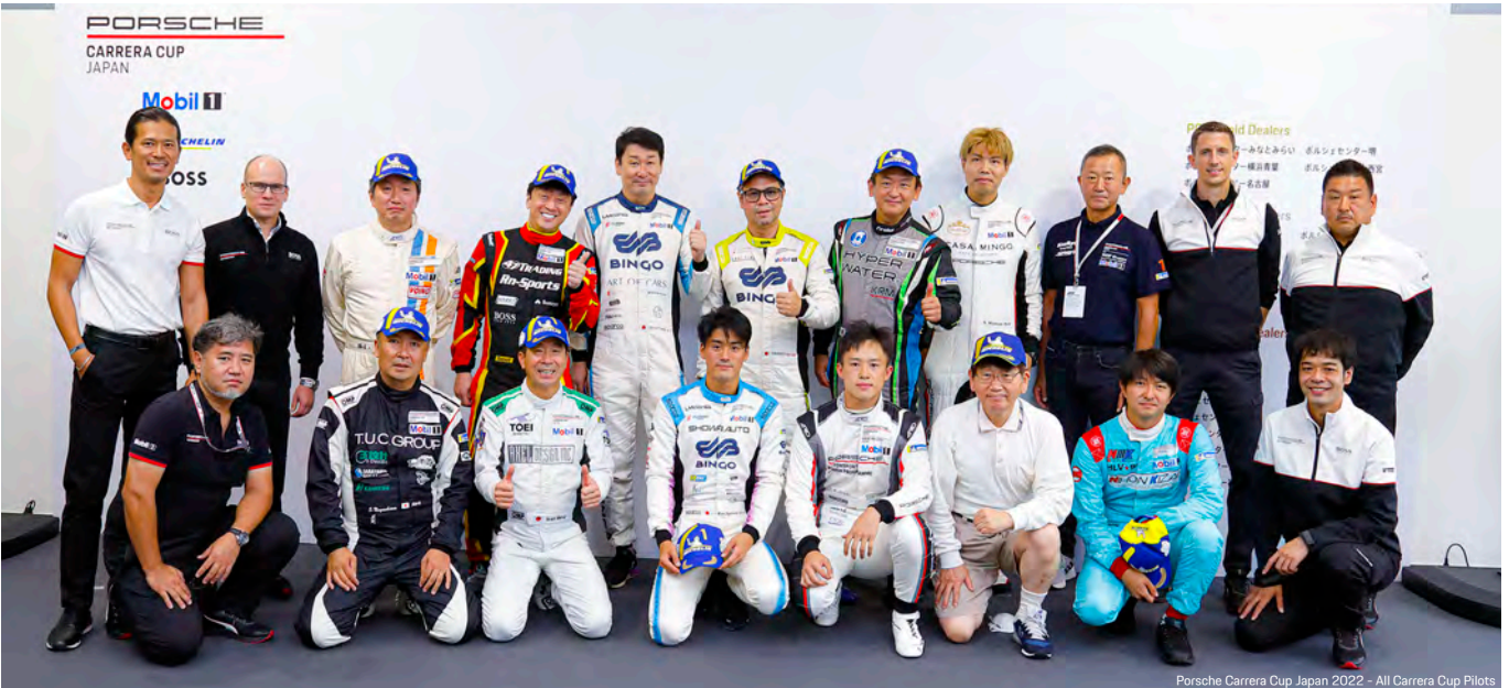
Porsche Carrera Cup Japan 2022 - All Carrera Cup Pilots