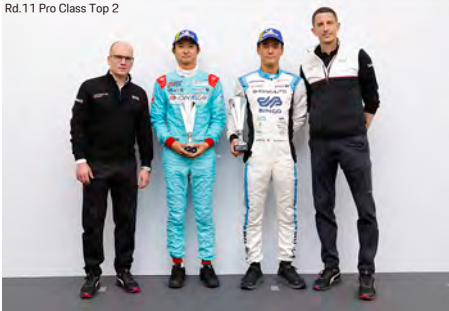
Rd.11 Pro Class Top 2