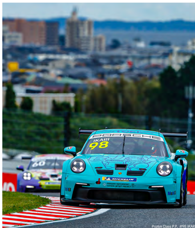
ProAm Class P.P. #98 IKARI

最終戦となる第 11 戦の決勝レースは 9 日(土) 11 時 05 分スタート(10 周もしくは 30 分間)を予定する。これが今シーズン最後のレースであり、F1 のサポートレースでもあるため各ドライバーともいつも以上に気合いの入った走りを見せてくれるはずだ。