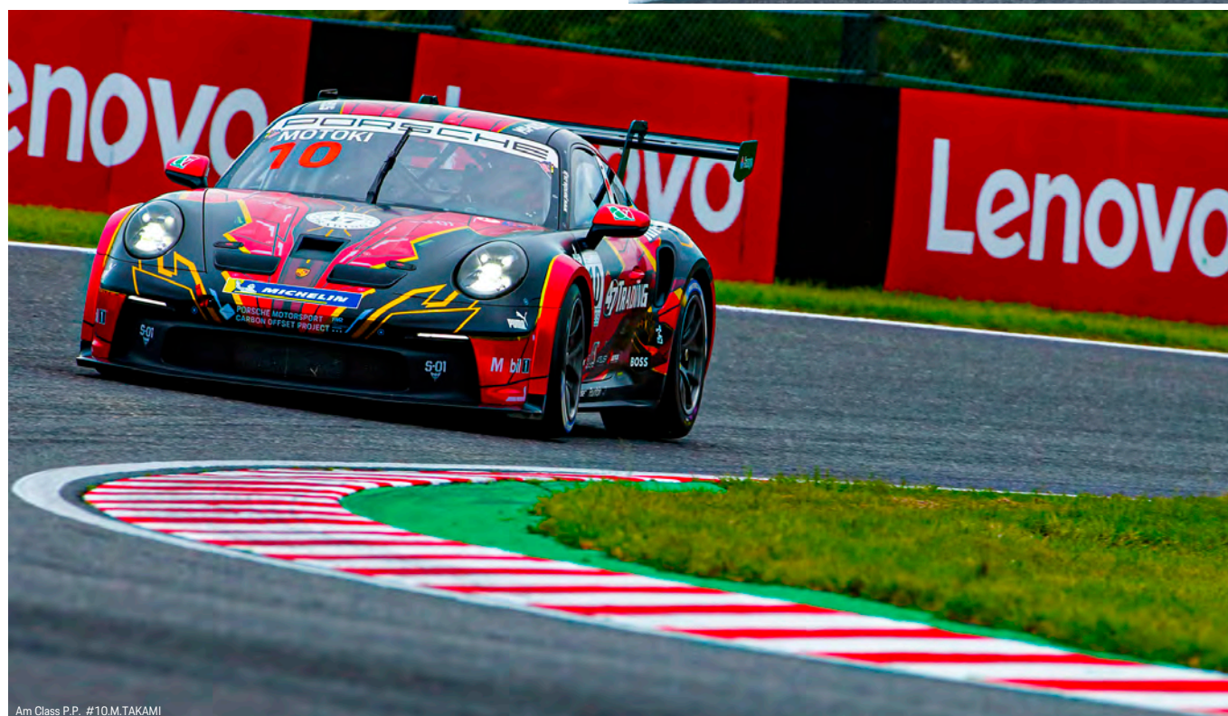
Am Class P.P. #10.M.TAKAMI