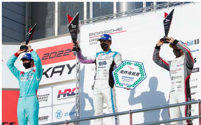
Pro Class Podium