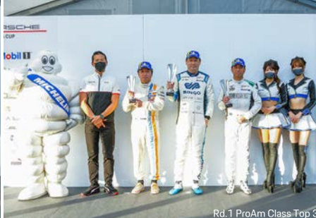
Rd.1 ProAm Class Top 3