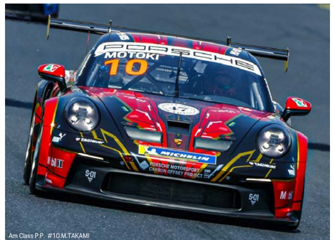
Am Class P.P. #10.M.TAKAMI