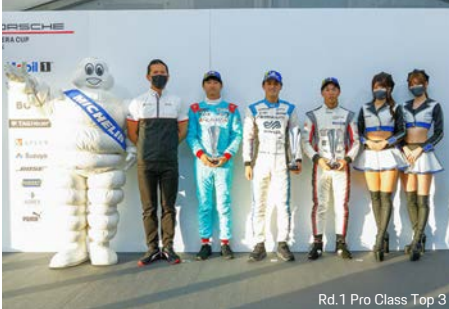
Rd.1 Pro Class Top 3