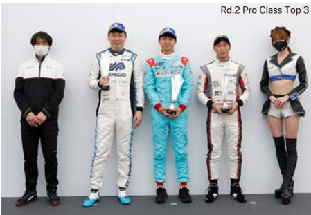
Rd.2 Pro Class Top 3