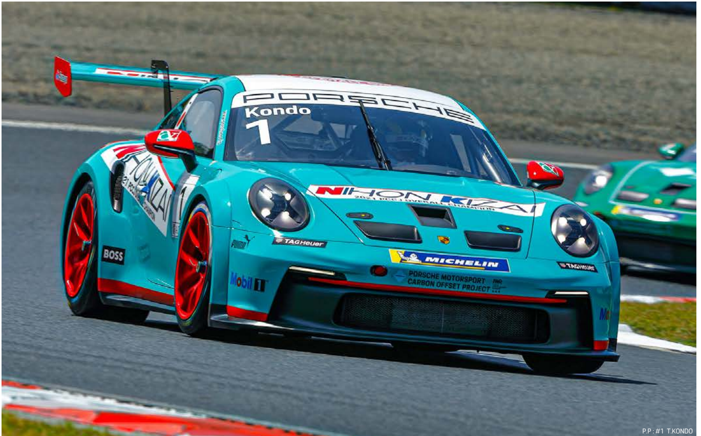
P.P.: #1 T.KONDO