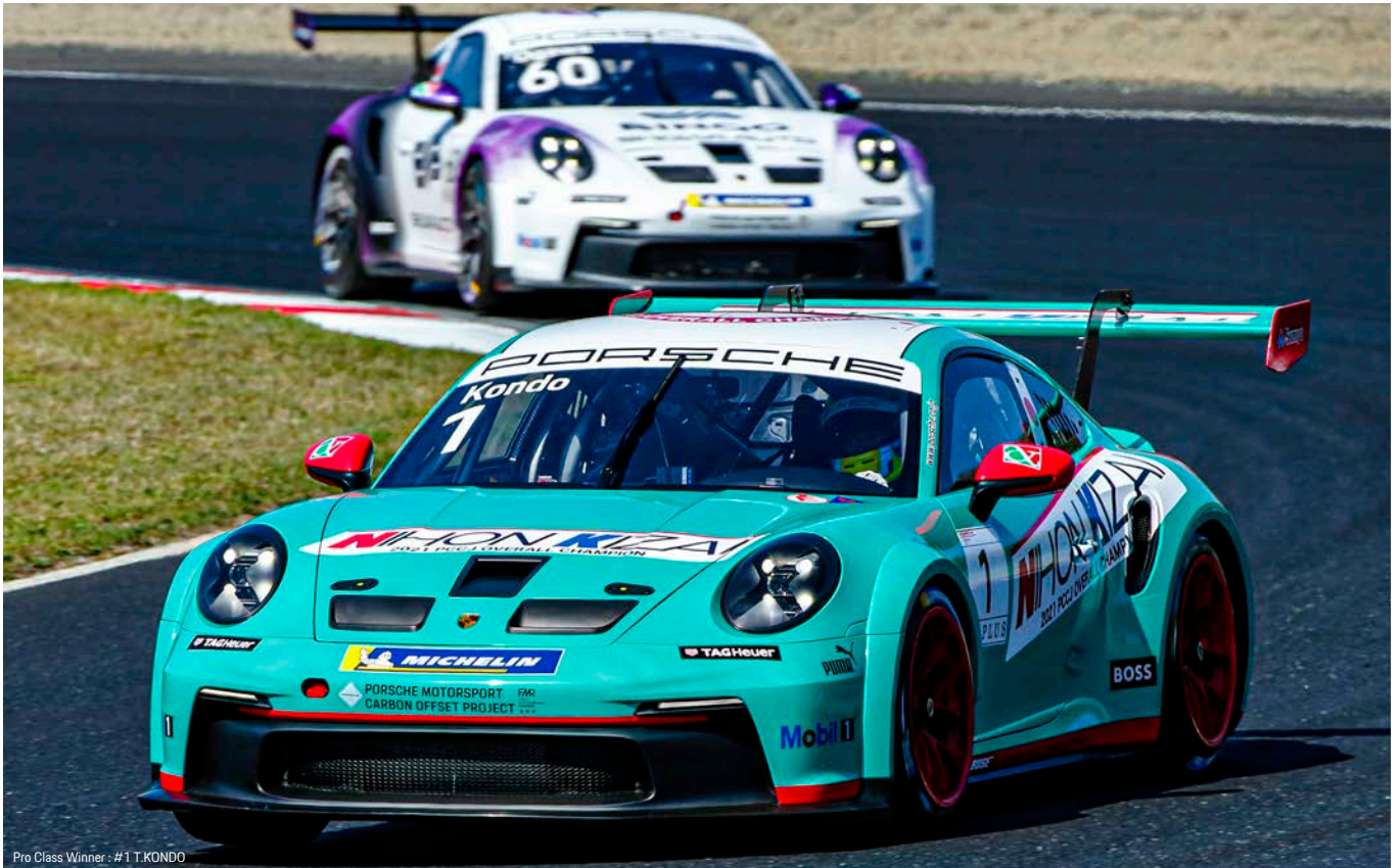
Pro Class Winner : #1 T.KONDO