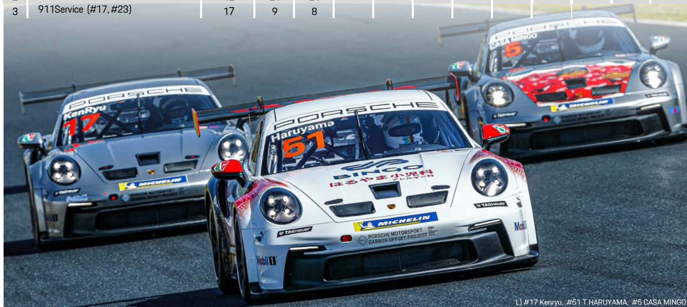
L) #17 Kenryu, #51 T.HARUYAMA, #5 CASA MINGO