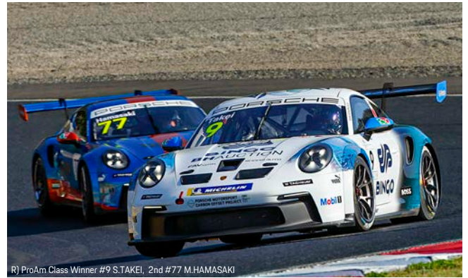
RJ ProAm Class Winner #9 S.TAKEI, 2nd #77 M.HAMASAKI

PCCJ 第 2 戦の決勝レース(15 周もしくは 30 分間)は 4 月 17 日(日) 9 時 15 分のスタートを予定している。スターティンググリッドの各クラスポールポジションは、プロクラスが #1 近藤、プロアマクラスが #9 武井真司、アマクラスが #10 MOTOKI TAKAMI となっている。なお、第 2 戦の決勝レースの様相もポルシェジャパンの twitter アカウント (@PorscheJP) でライブストリーミング配信される。