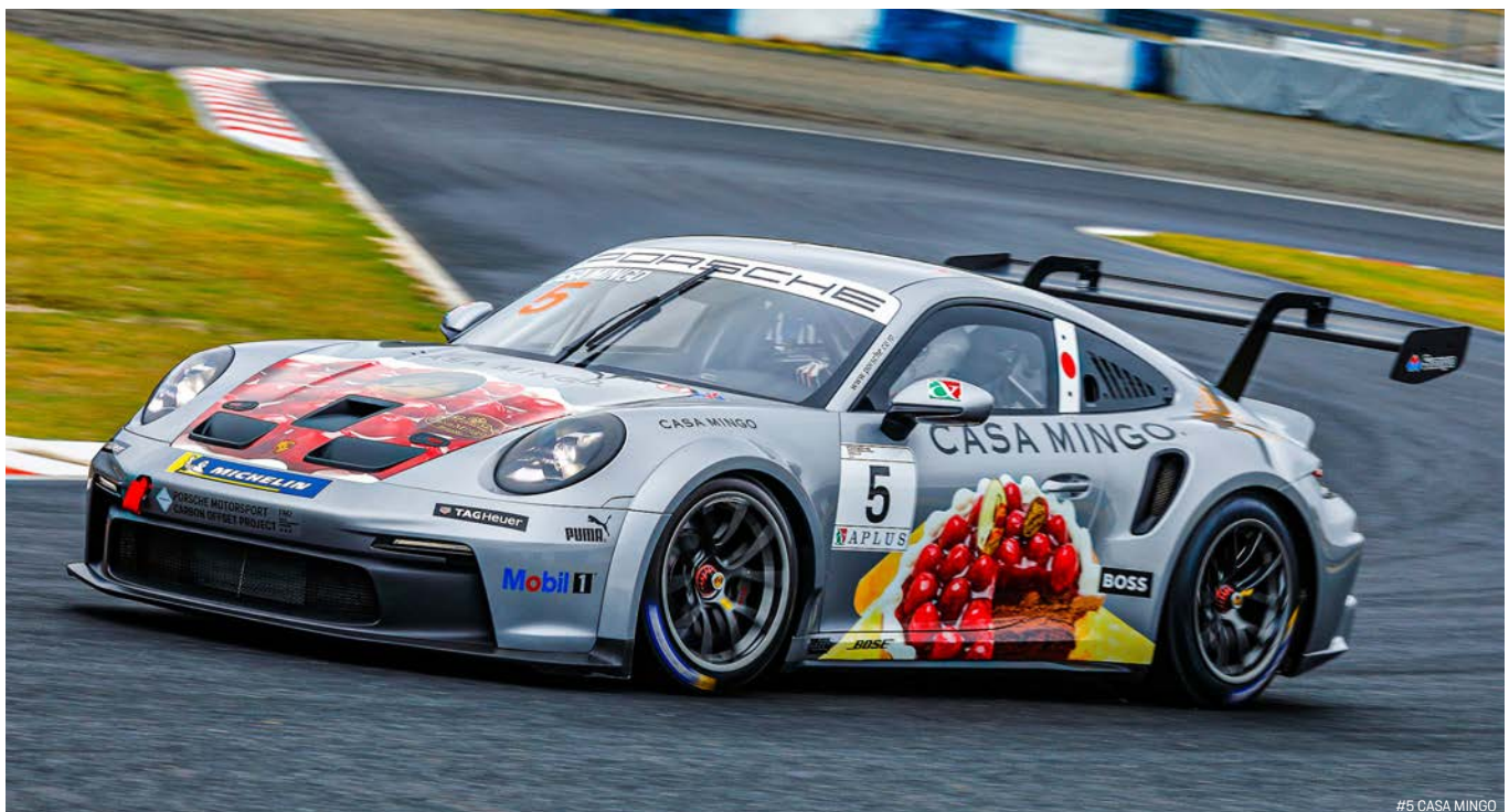
#5 CASA MINGO