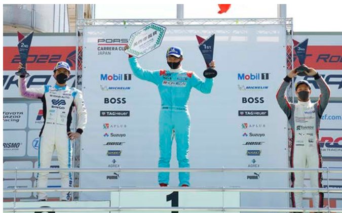
Pro Class Podium