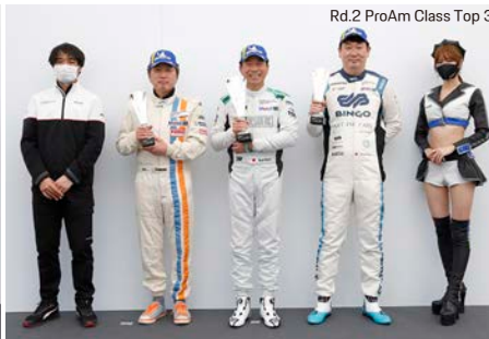
Rd.2 ProAm Class Top 3