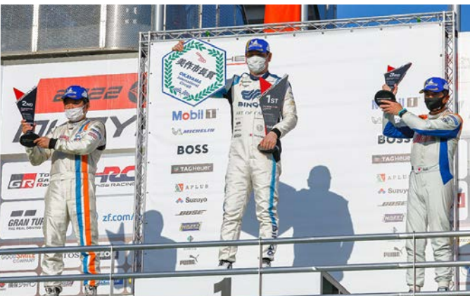
ProAm Class Podium