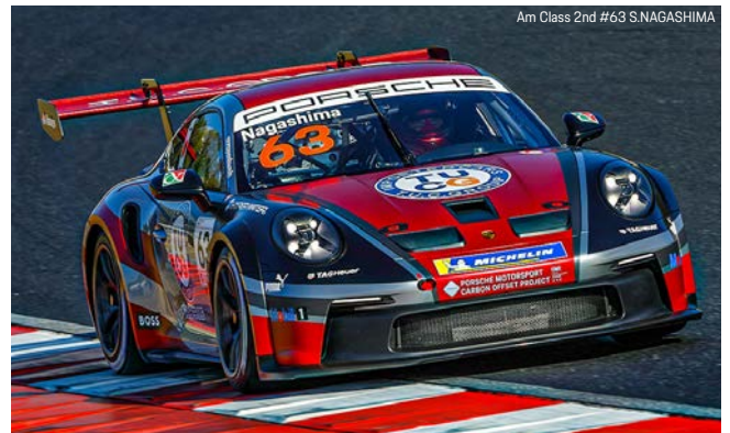
Am Class 2nd #63 S.NAGASHIMA