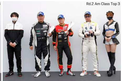
Rd.2 Am Class Top 3