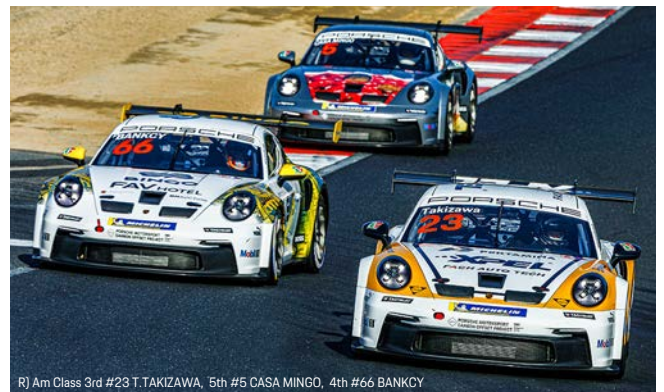
RJ Am Class 3rd #23 T.TAKIZAWA, 5th #5 CASA MINGO, 4th #66 BANKKY