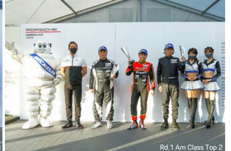
Rd.1 Am Class Top 2