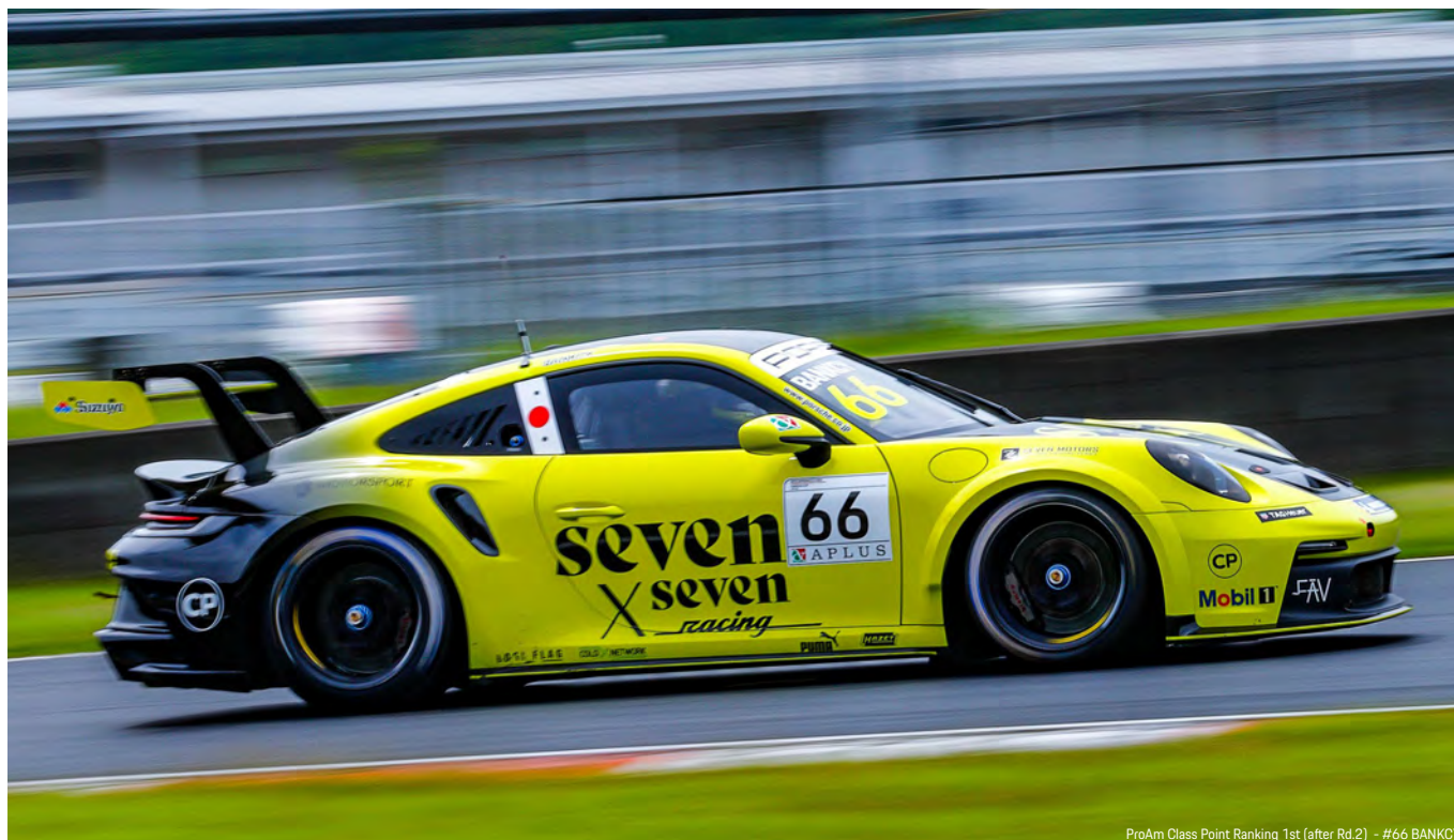
ProAm Class Point Ranking 1st (after Rd.2) - #66 BANKCY