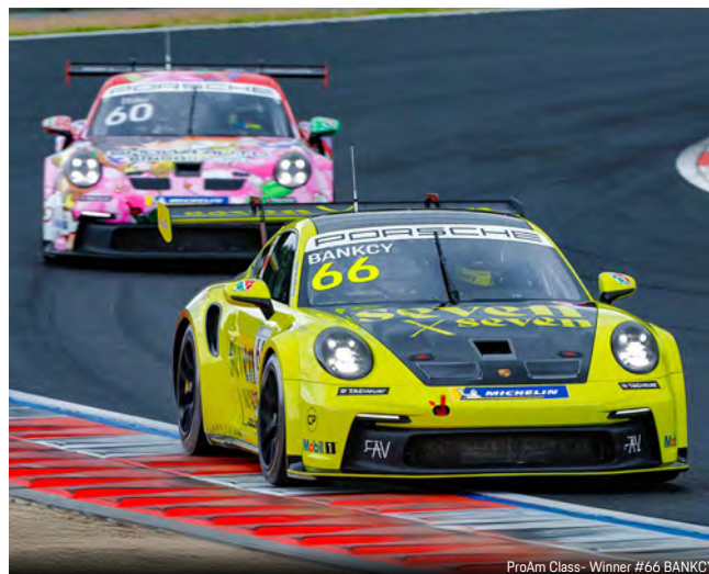
ProAm Class- Winner #66 BANKCY

第5戦ライブ配信 URL（配信予定：5月25日14時50分～） https://www.youtube.com/live/HjN0zq_3QI8?si=HkEo4mdbnKKTN8TO