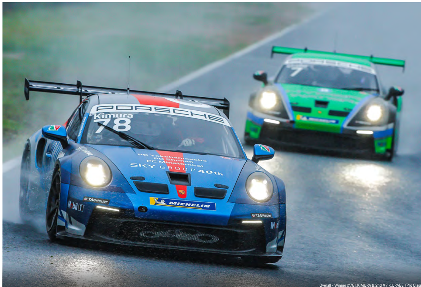
Overall - Winner #78 I. KIMURA & 2nd #7 K. URABE (Pro Class)