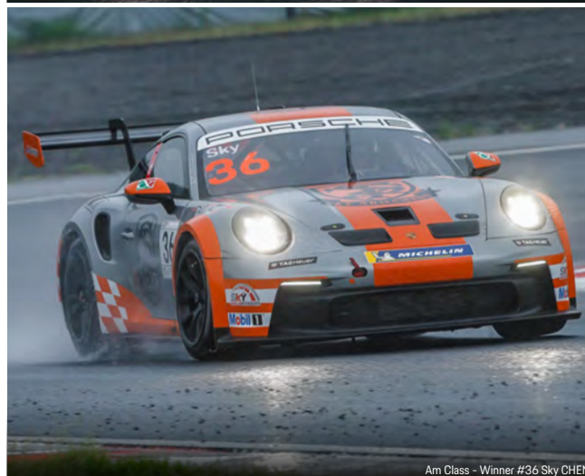
Am Class - Winner #36 Sky CHEN