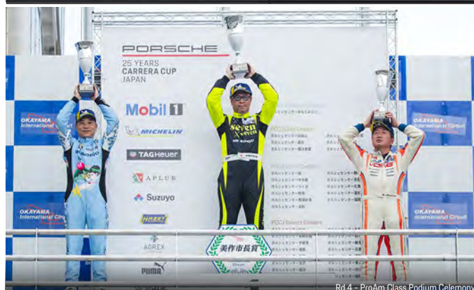
Rd.4 - ProAm Class Podium Ceremony