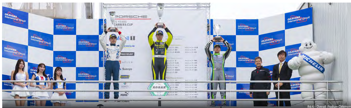
Rd.4 - Overall Podium Ceremony

ベストラップ : 99 渡会 太一 1'30.502 5/17 147.298km/h