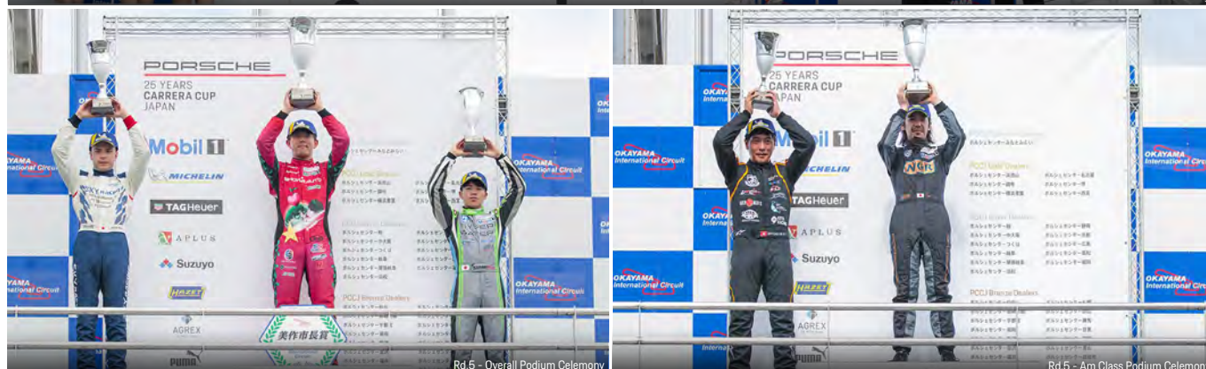
Rd.5 - Overall Podium Ceremony