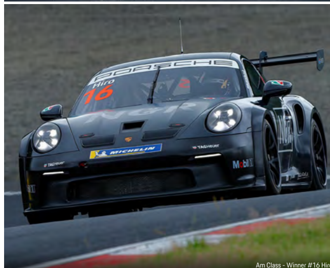
Am Class - Winner #16 Hiro