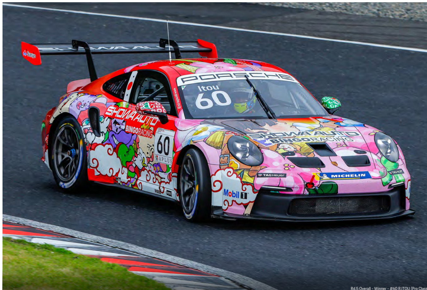
Rd.5 Overall - Winner - #60 R.ITOU (Pro Class)