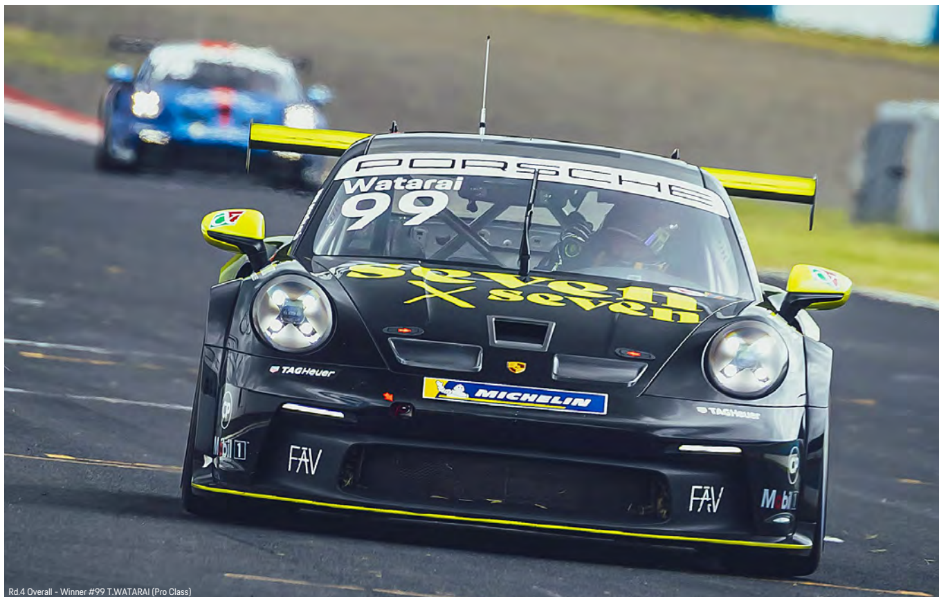
Rd.4 Overall - Winner #99 T.WATARAI (Pro Class)