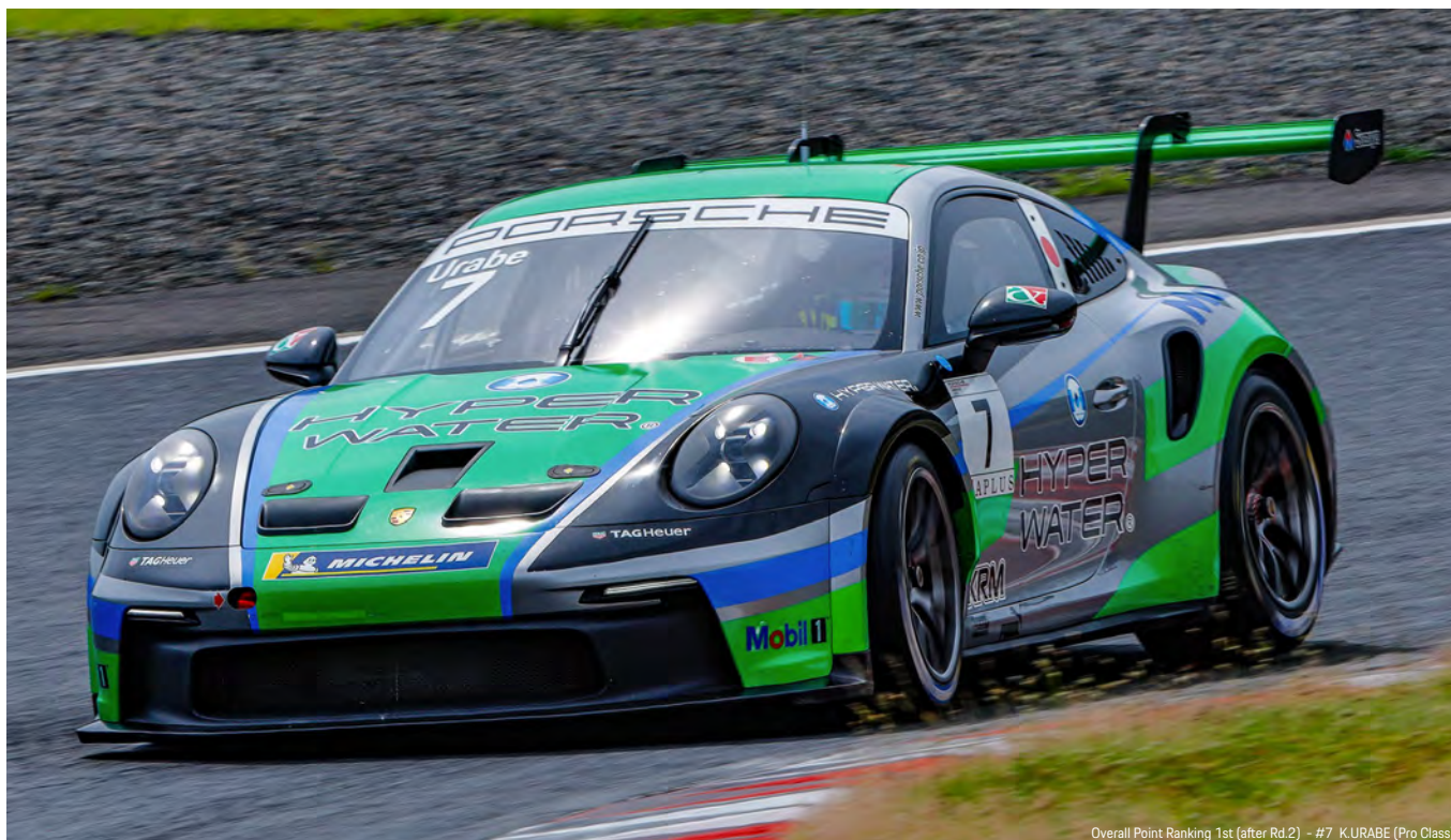
Overall Point Ranking 1st (after Rd.2) - #7 KURABE (Pro Class)

4月4～6日に鈴鹿サーキットで開催されたF1日本GPのサポートレースで今シーズンの幕を開けたPCCJ。2001年にスタートし今年で開催25年目を迎えたPCCJは、国内のワンメイクレースでもっとも長い歴史を誇り、これまでに数多くのトップドライバーを輩出している。今シーズンは5大会11戦を予定しており、前回の鈴鹿大会から約1カ月半振りに迎えたこの岡山は1大会3レースの開催となる。24日午前に行われる30分間の予選結果により、各車のベストタイム順で第3戦決勝のグリッドが決まり、セカンドベストタイム順で第4戦決勝のグリッドが決定。そして3レース目となる第5戦のグリッドは第3戦決勝の正式総合結果順となる。決勝レースは第3戦が24日午後、第4戦が25日午前、そして第5戦は25日午後開催される。