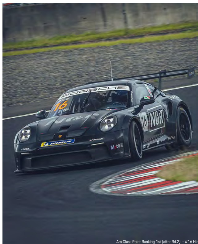
Am Class Point Ranking 1st (after Rd.2) - #16 Hiro

PCCJ 第 3-5 戦岡山大会のスケジュールは、専有走行が 5 月 23 日（金）の 10 時 35 分～11 時 20 分と 13 時 55 分～14 時 40 分の 2 回（各 45 分間）。予選は、5 月 24 日（土）10 時 35 分～11 時 05 分の 30 分間。決勝レースは、第 3 戦が 5 月 24 日（土）15 時 35 分スタート、第 4 戦が 5 月 25 日（日）10 時 35 分スタート、第 5 戦が 5 月 25 日（日）14 時 55 分スタートの予定で、いずれも 17 周もしくは 30 分間で行われる。なお、第 3-5 戦の決勝レースはポルシェジャパン公式 Youtube チャンネル ( https://www.youtube.com/@PorscheJapanOfficial ) にてライブ配信を予定している。