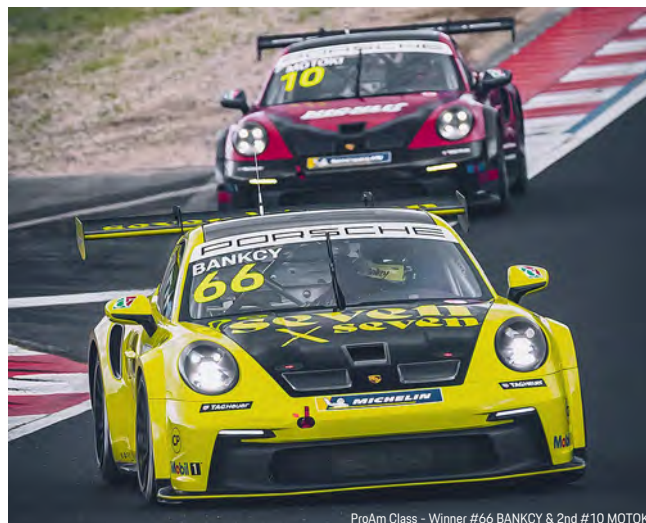
ProAm Class - Winner #66 BANKKY & 2nd #10 MOTOKI

今シーズンの PCCJ は全 11 戦で競われているため、次回の第 6-7 戦はシーズン中盤戦と、後半戦に向けてのランキング争いで重要な大会となってくる。その注目の大会は、約 2 カ月後の 7 月 19 日 (土)、20 日 (日) に富士スピードウェイ (静岡県) で開催を予定し、第 6 戦は MICHELIN Challenge、第 7 戦は Mobil 1 Challenge として開催される。