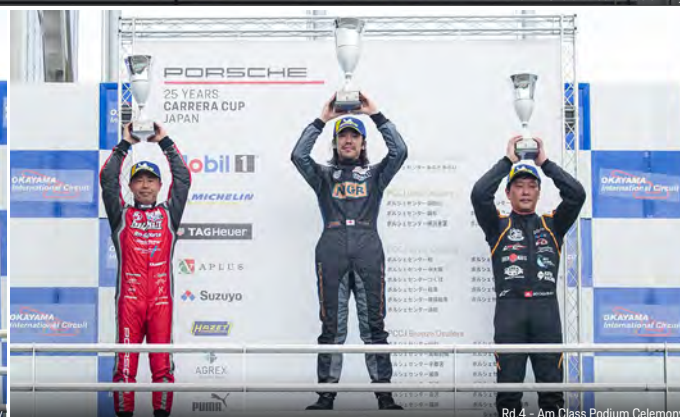
Rd.4 - Am Class Podium Ceremony