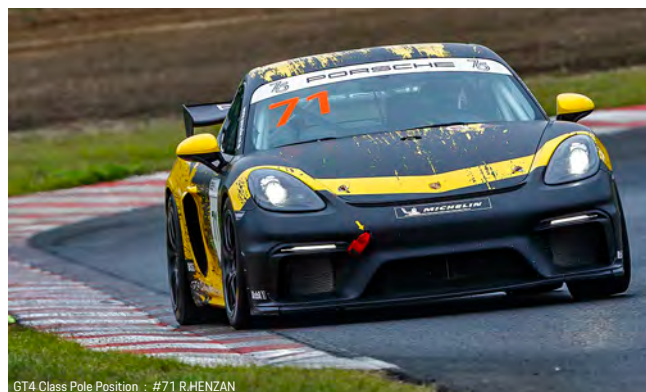
GT4 Class Pole Position : #71 R.HENZAN