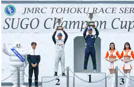
GT3-II Class Rd.3 : Top 2 Drivers