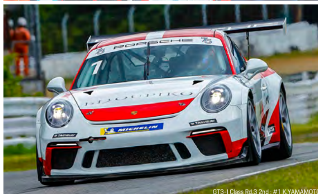
GT3-I Class Rd.3 2nd : #1 K.YAMAMOTO