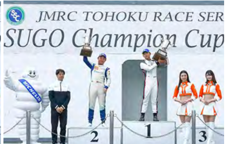
GT4 Class Rd.3 : Top 2 Drivers