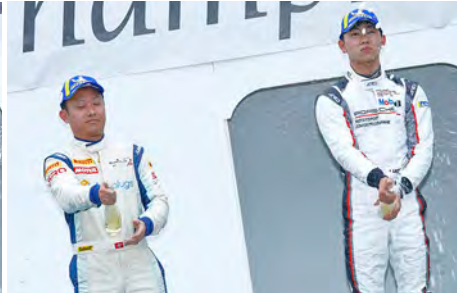
GT4 Class Rd.4 : Top 2 Drivers