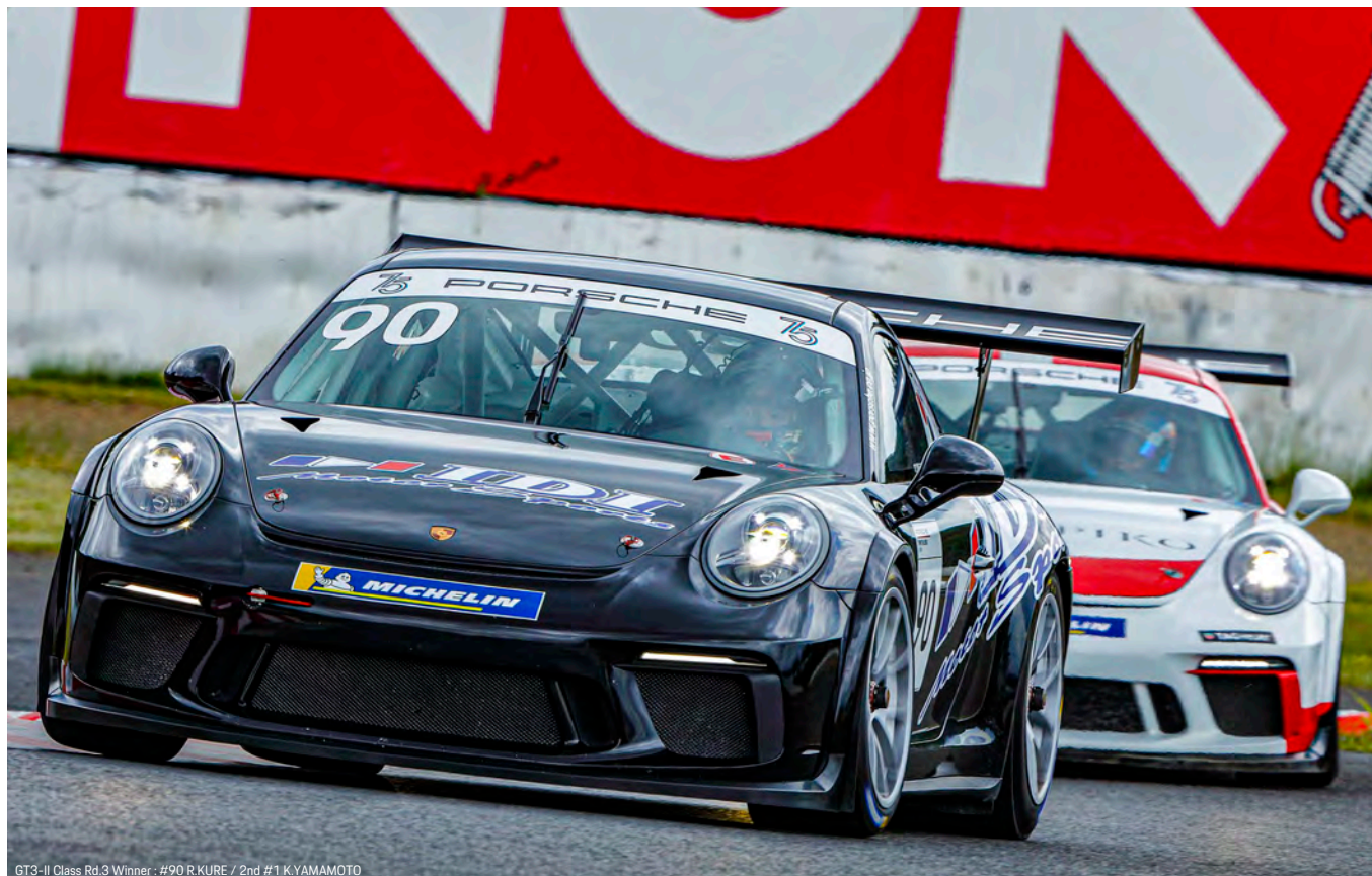
GT3-II Class Rd.3 Winner : #90 R.KURE / 2nd #1 K.YAMAMOTO

12:12 -12:33 /天候:晴れ/路面:ドライ/気温:20℃/路面:30℃