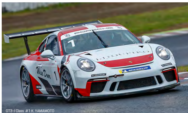
GT3-I Class #1 K. YAMAMOTO