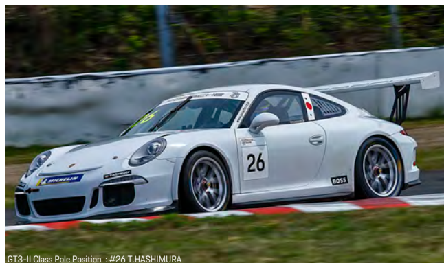
GT3-II Class Pole Position : #26 T.HASHIMURA