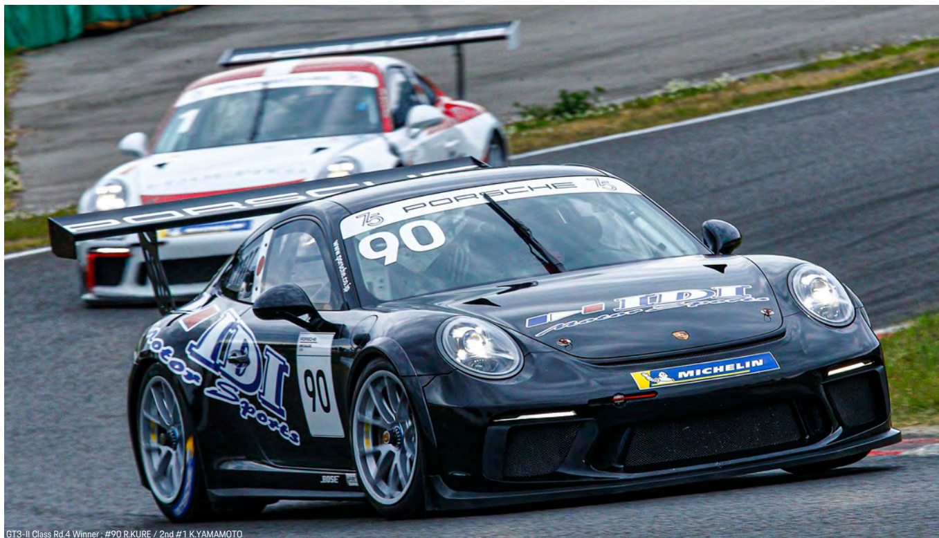
GT3-II Class Rd.4 Winner: #90 R.KURE / 2nd #1 K.YAMAMOTO

15:02-15:20 / 天候: 晴れ / 路面: ドライ / 気温: 19℃ / 路面: 24℃