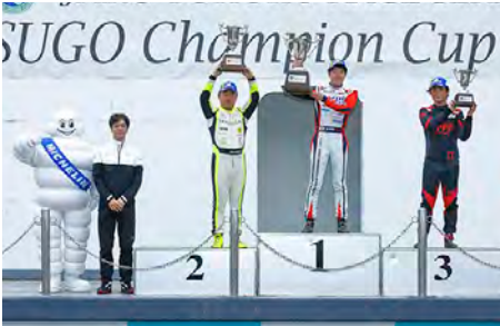
GT3-I Class Rd.4 : Top 3 Drivers