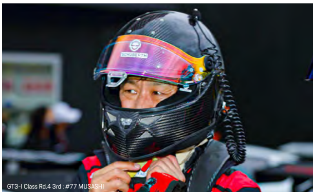
GT3-I Class Rd.4 3rd : #77 MUSASHI