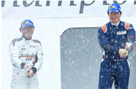
GT3-II Class Rd.4 : Top 2 Drivers